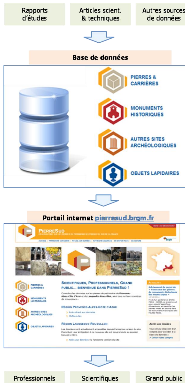
Schéma d'ensemble de l'Observatoire...